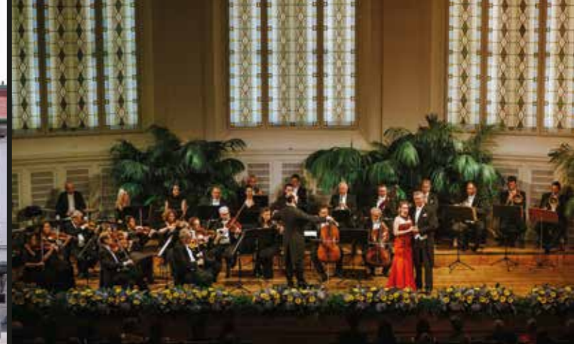
KONZERTHAUS – MOZARTSAAL

Das WIENER HOFBURG-ORCHESTER freut sich, seinen Gästen einen unvergesslichen Wiener Abend mit den schönsten und beliebtesten Kompositionen vom „König der Walzer“, Johann Strauss, sowie Arien und Duette aus W. A. Mozarts Opern in den prunkvollen Sälen der Wiener Hofburg anzubieten. Das Orchester besteht aus 40 Musikern, internationalen Gesangssolisten und klassischem Ballett von der Wiener Staats- bzw. Volksoper.