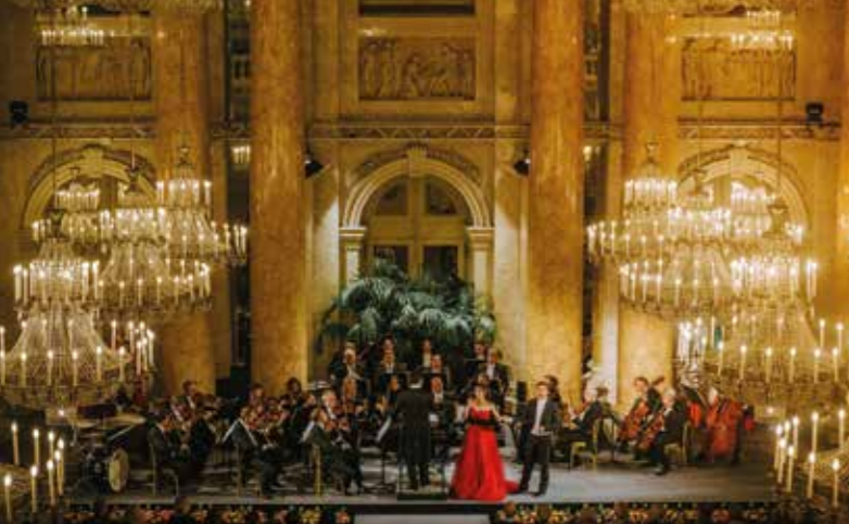
WIENER HOFBURG – ZEREMONIENSAAL