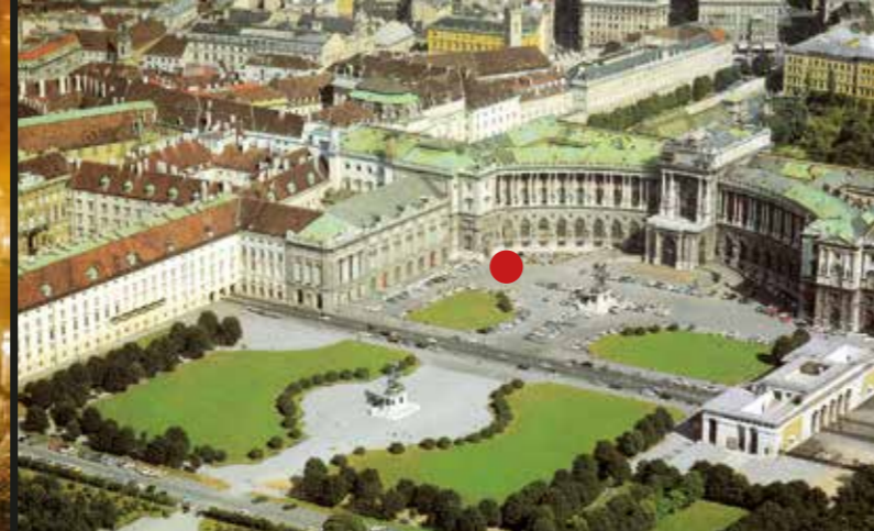
WIENER HOFBURG, 1010 Wien, Heldenplatz 1, Kongresszentrum ● Eingang/Entrance/Entrée (U1, U2, U3, U4, D, 1, 2)